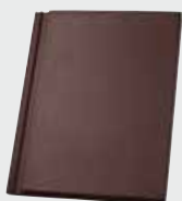
LONGLIFE matt dunkelbraun (126)