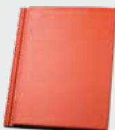
LONGLIFE matt ziegelrot (101)