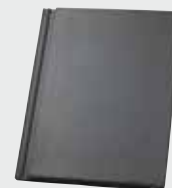
LONGLIFE matt dunkelgrau (145)