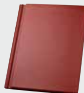
LONGLIFE matt dunkelrot (109)*