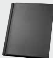
LONGLIFE matt granit (172)